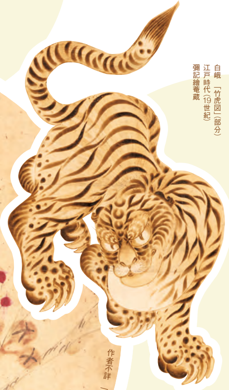
白織「竹虎図」部分 江戸時代10世紀 彌記繪藏

技法の特殊さから作例は多くありませんが、 一部の間では試みられていた様子がうかがえます。 また、大田南畝と来舶した 中国人との間で焼絵談議が行われ、 朝鮮通信使を介し烙画が紹介されるなど、 焼絵を通じた国際交流も行われました。 本展では、これまでほとんど 紹介されることなかった焼絵について、 日本をはじめ朝鮮と中国、現代の焼絵作品を展覧し、 その美と制作背景を探ります。