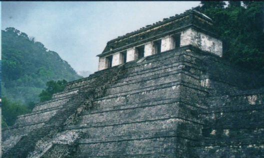
マヤ文明 碑文の神殿(パカル王墓) *1