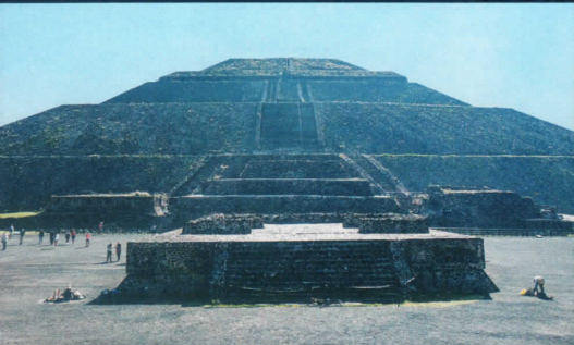
テオティワカン文明 太陽のピラミッド *1