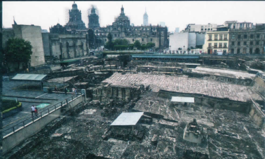
アステカ文明 テンプロ・マヨール(大神殿) *1

太陽「月 羽毛の蛇」の一大ピラミッドを擁する巨大な計画都市を築いた テオティワカン文明