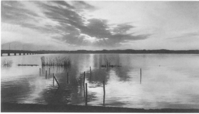
大畑稔浩《仰光一霞ヶ浦》2008年