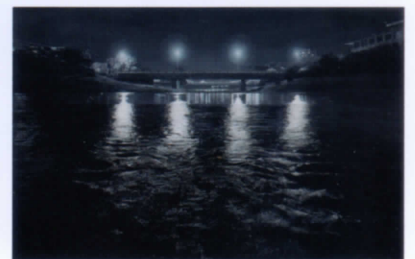
中西優多朗《夜の鴨川》2020年

第4回ホキ美術館大賞展 2022年11月18日(金)～2023年2月27日(月) ギャラリー2 入選作品25点を展示いたします。また来館者の投票により、特別賞作品が決まります。 特別賞の投票は1月30日まで。発表は2月8日を予定しております。