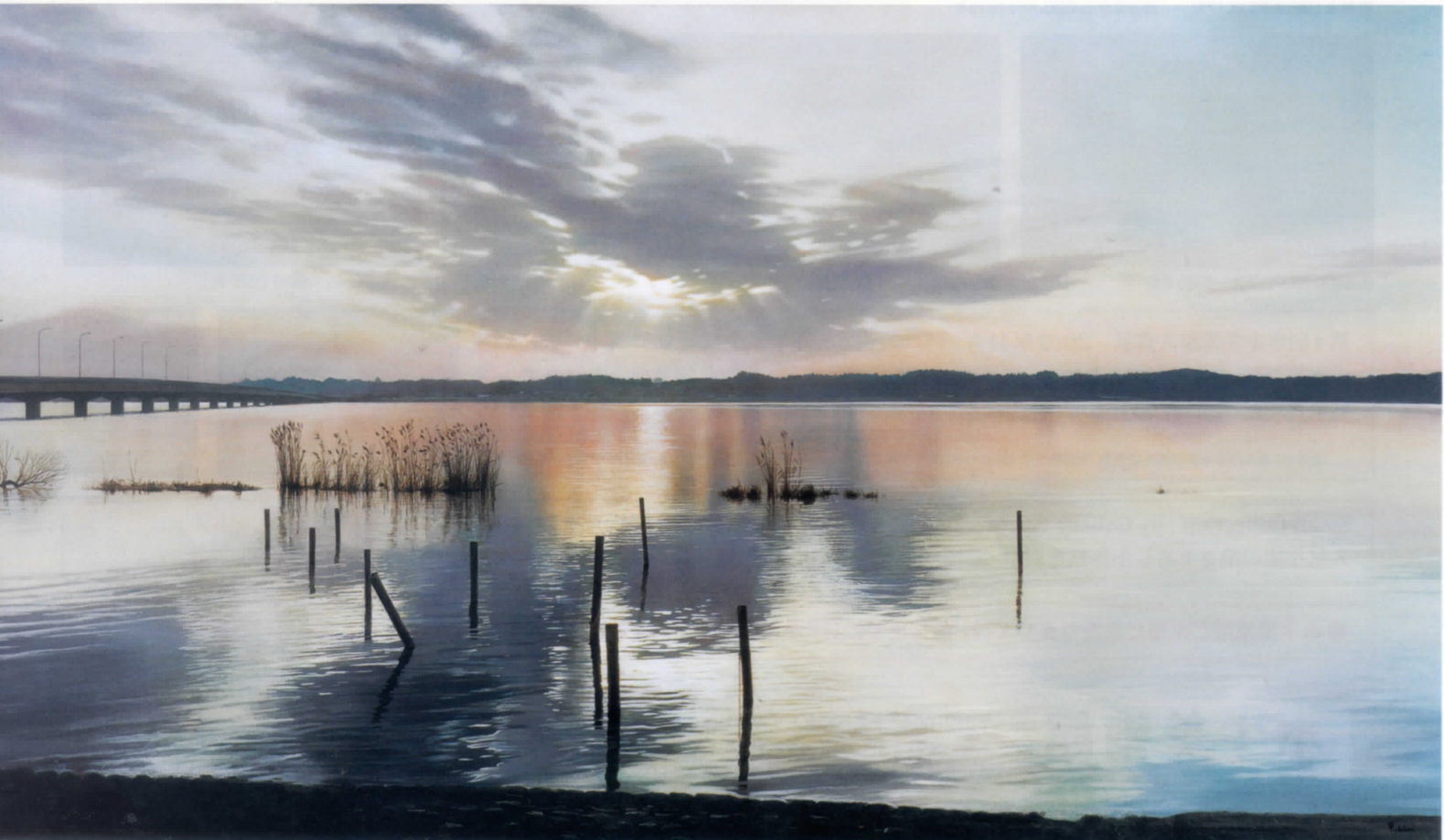
大畑稔浩《仰光一霞ヶ浦》2008年