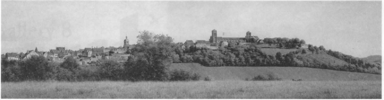
森本 草介 「VÉZELAY」