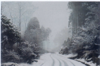
大畑稔浩《野呂山風景—雪道》2021年