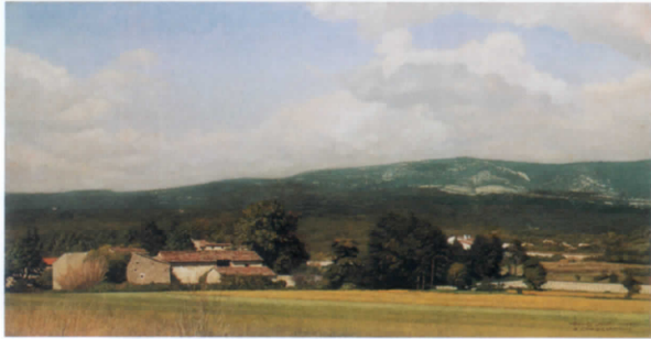
青木敏郎《プロバンスの農家》1985年