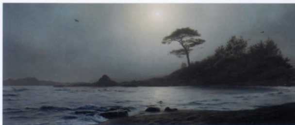
塩谷 亮《立石霧景》2022年