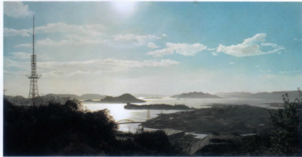
大畑稔浩《瀬戸内風景》2004年