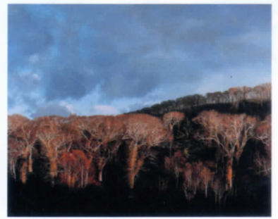
野田弘志《オロフレ峠》2010年