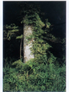
五味文彦《木霊の囁き》2010年