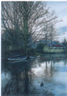
原 雅幸《薄氷の日》2017年