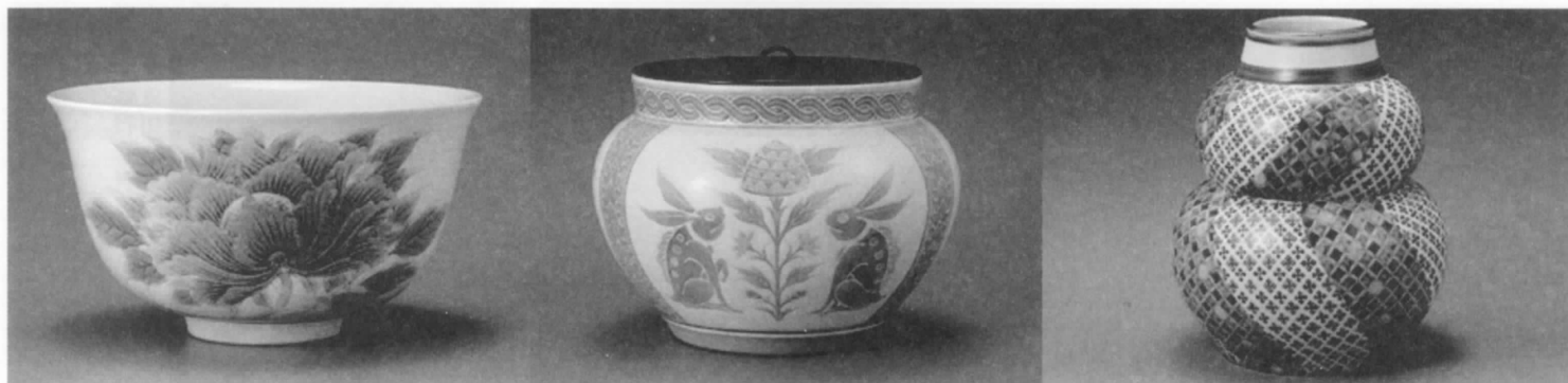
板谷 波山 茶碗牡丹文