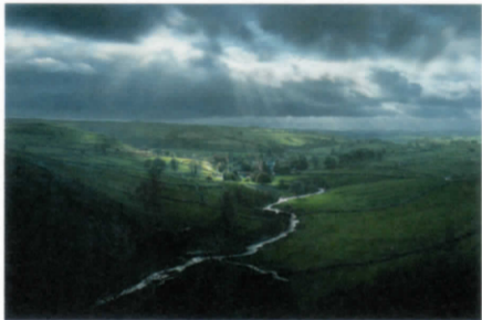
原 雅幸《Malhamの光る川》2018年