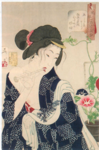
「風俗三十二相 めがさめさう」