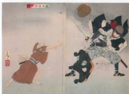
「新撰東錦絵 義士夜討之図」