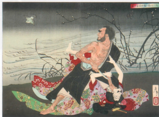
「新撰東錦絵 大仁坊梅ヶ枝を殺害の図」