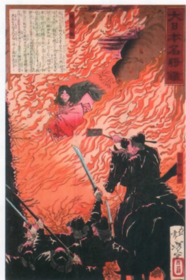
「大日本名將鑑 狭穂姫 上毛野八綱田」