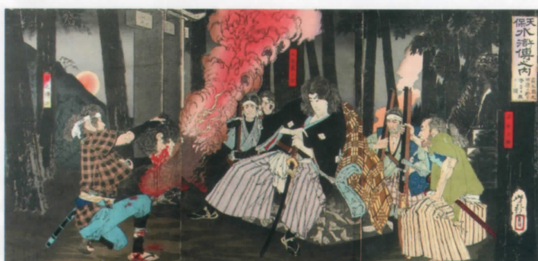
「天保水滸伝之内 霧太郎太田原二於テ勢カラ救フノ図」