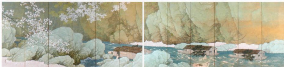
川合玉堂《行く春》1916年 重要文化財(展示期間: 3.17(金) - 5.1(月))

当館の開館70周年を記念して、明治以降の絵画・彫刻・工芸のうち、重要文化財に指定された作品のみによる豪華な展覧会を開催。年に一度、春の時期に公開している川合玉堂《行く春》は、本企画展にて展示します。