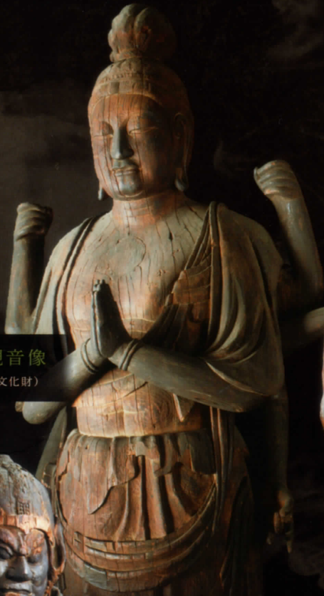
不空羼索観音像 (天平時代 重要文化財)