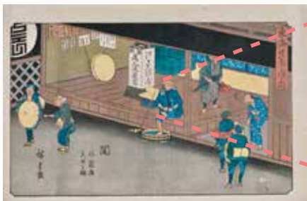
歌川広重「東海道五十三次之内 関 旅籠屋見世之図」(後期)