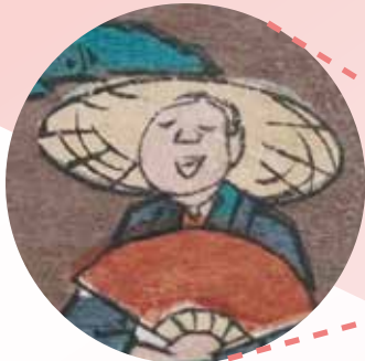
味わい深いおじさん発見！