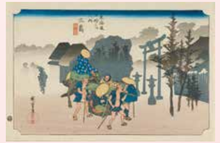
歌川広重「東海道五拾三次之内 三島 朝霧」(後期)