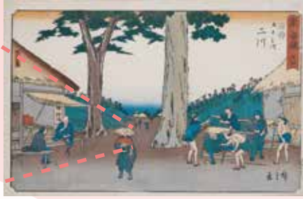
歌川広重「東海道 卅四 二川 猿か馬場」(前期)