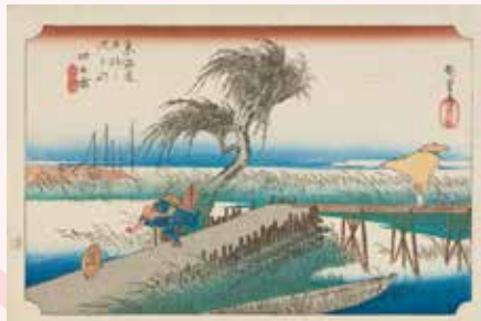
歌川広重「東海道五拾三次之内 四日市 三重川」(後期)