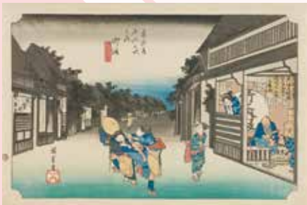
歌川広重「東海道五拾三次之内 御油 旅人留女」(前期)