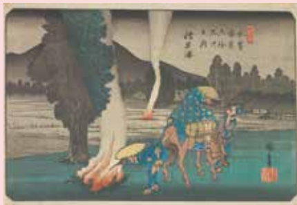
歌川広重「木曾海道六拾九次之内 拾九 軽井沢」(前期)