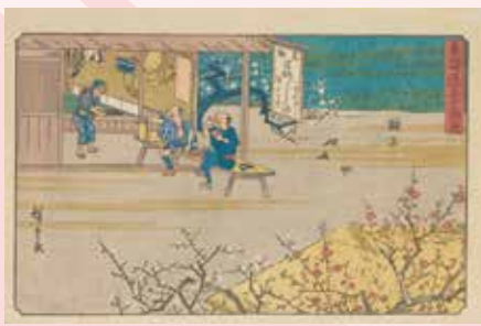
歌川広重「東海道五十三次之内 鞠子」(前期)