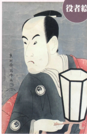
東洲斎写楽 三世坂東彦三郎「鷺坂左内」

今企画展では、江戸時代から明治時代当時に摺られたオリジナルの浮世絵版画を「名所絵」や「武者絵」等のジャンル別に約60点展示いたします。江戸時代に大衆文化として発展した浮世絵は、世相や生活文化の特色を描いているのが大きな特徴で、題材は非常に多種多様です。中でも、江戸時代の最大の娯楽とも言われる歌舞伎のブームに伴って人気を博した「役者絵」は、沢山の絵師が人気役者を描きました。今企画展では、「役者絵」といえば思い浮かべる人も多い絵師である、東洲斎写楽のデビュー作から2作品を展示いたします。写楽は活動期間わずか10か月で忽然と姿を消し、世界でも作品の現存数は少なく、鑑賞の機会も珍しい作品となっております。江戸・明治時代の人々が愛した様々な文化を、浮世絵版画を通して間近でじっくりとお楽しみください。