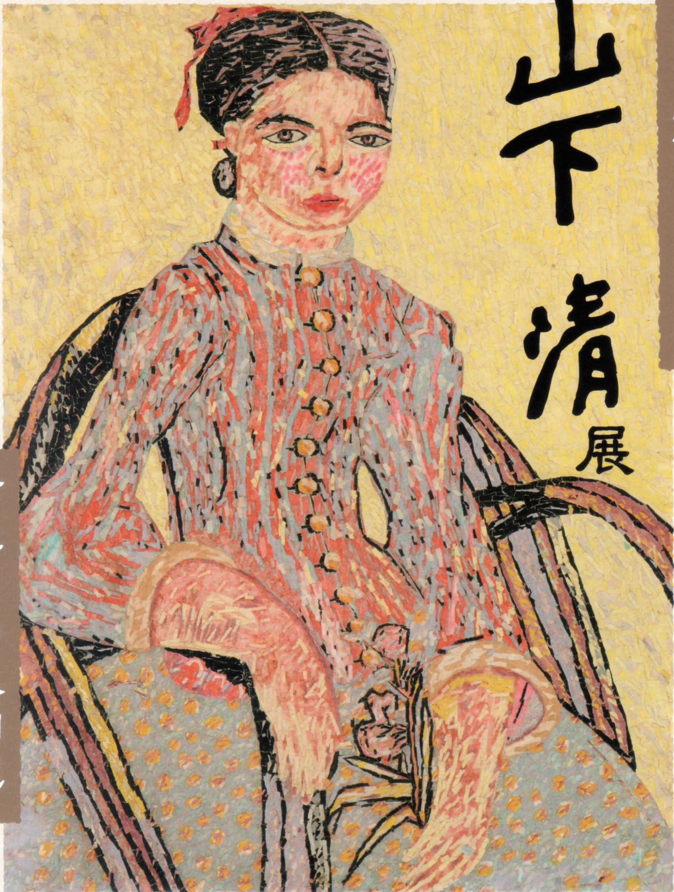
『オアシス(娘)』油絵/1940(昭和15)年 ©Kiyoshi Yamashita/STEPEast 2022