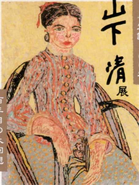
(ラ・ムスメ(娘)-ゴッホによる)貼絵/1940(昭和15)年 ©Kiyoshi Yamashita/STEPeast 2022