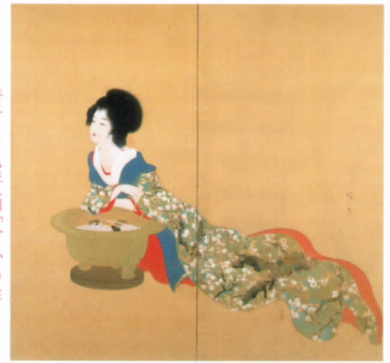
清方自己評価「会心の作」

小説や芝居からもインスピレーションを得た清方。泉鏡花『通夜物語』の主人公、丁山を妖艶に描いた物語絵の名品。