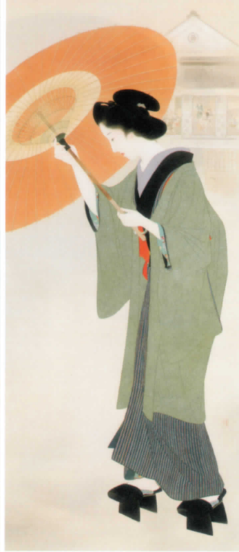
左から：浜町河岸 1930(昭和5)年／築地明石町 1927(昭和2)年／新富町 1930(昭和5)年 いずれも東京国立近代美術館