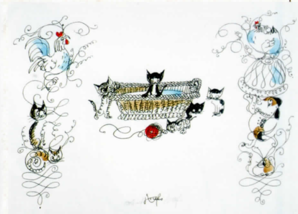
エルンスト・クライドルフ 絵本『花のメルヘン』より 小さな絵本美術館蔵