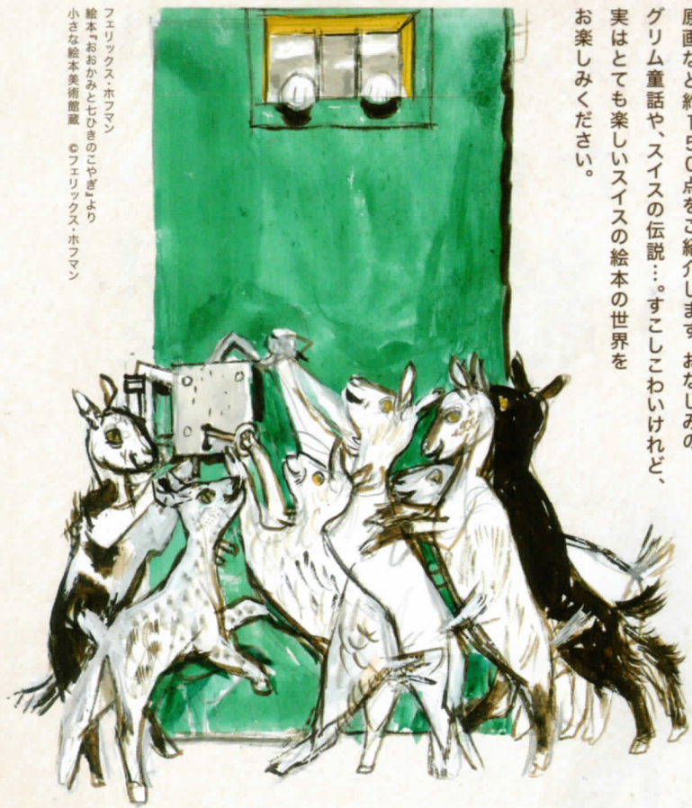
フェリックス・ホフマン 絵本『おおかみと七ひきのこやぎ』より 小さな絵本美術館蔵 ©フェリックス・ホフマン

本展では長野県にある小さな絵本美術館協力のもと、ハンス・フィッシャーの手描き絵本 エルンスト・クライドルフの初版リトグラフやフェリックス・ホフマンの 原画など約150点をご紹介します。おなじみの グリム童話や、スイスの伝説…。すこしこわいけれど、 実はとても楽しいスイスの絵本の世界を お楽しみください。