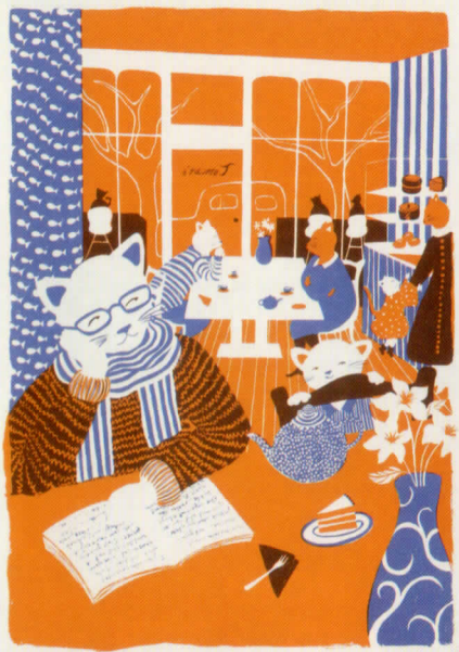
ジュンリー・ソング (USA) 「ねこたちの秘密の生活」