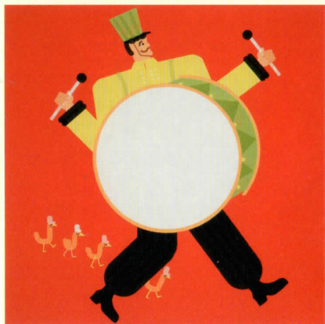
ガイア・ステッラ (イタリア) 「すばらしいオーケストラ」