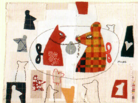
平佐 実香 (ミカオ) (日本) 「インソップものがたり」