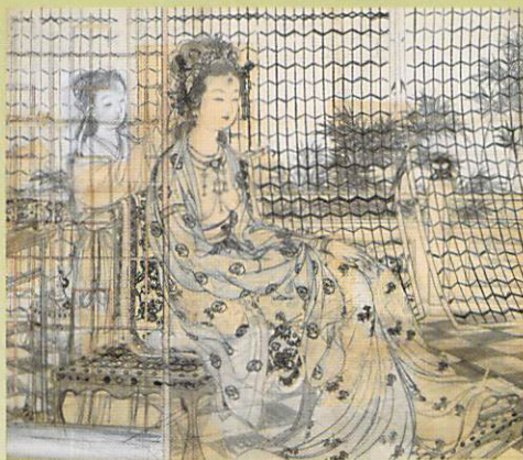
上村松園「楊貴妃」下絵 大正11年 (前期)