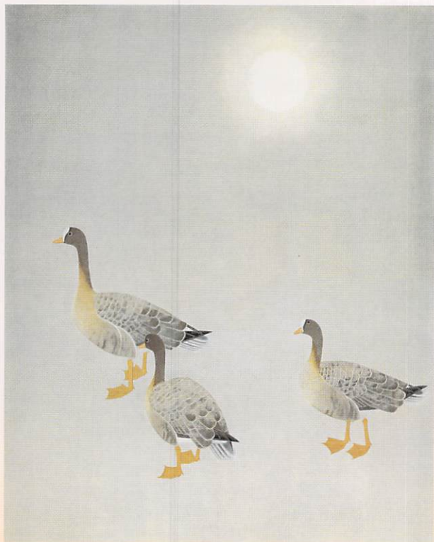
上村松篁「雁金」昭和57年(前・後期)