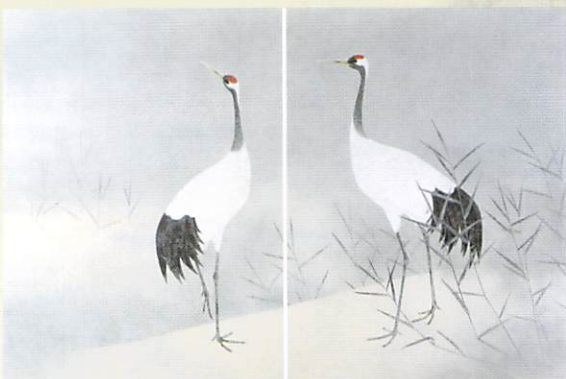
上村淳之「丹頂鶴」昭和47年 (前・後期)