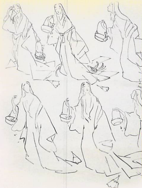
上村松園「花がたみ」の小下絵