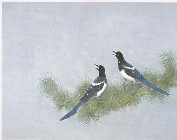
上村淳之「鶴」平成14年(前・後期)