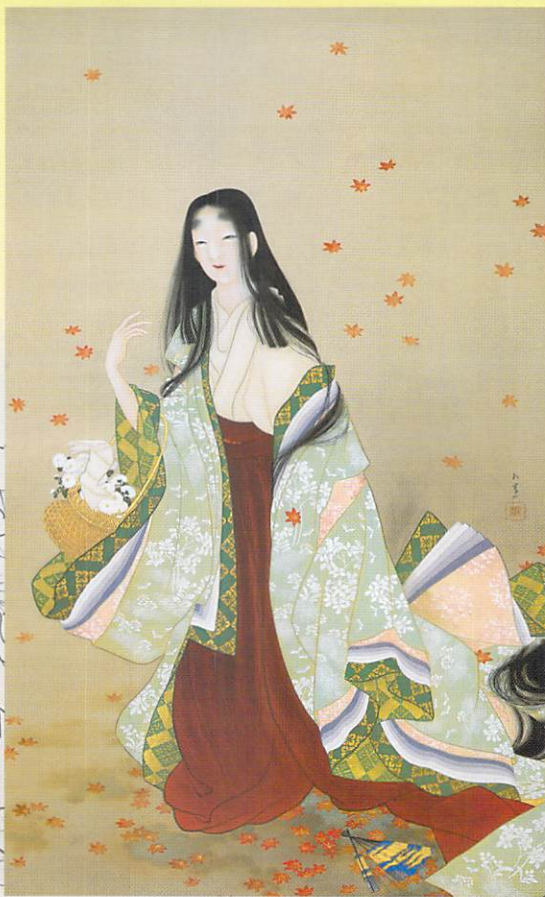
上村松園「花がたみ」大正4年(前・後期)