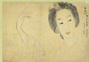
上村松園「花がたみ」のための素描(前・後期)