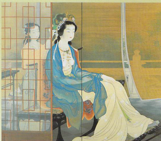
上村松園「楊貴妃」大正11年 (前期)