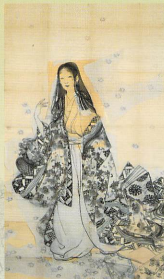
上村松園「花がたみ」下絵 大正4年(前・後期)