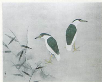
上村松篁「伍位鷺」平成7年 (前・後期)