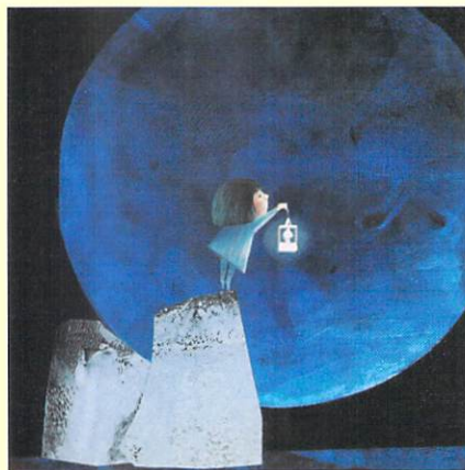
アンドレヤ・ベクラール (スロヴェニア) 「わたしのお月さま」