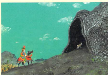
●特別展示1 マヌエル・マルソル (スペイン) 「ドン・フェルミンの伝説」