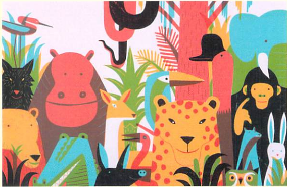
ジュアン・ネグレスコロール (スペイン) 「動物たちの町」