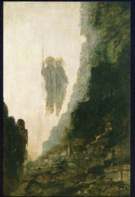
ギュスターヴ・モロー 《ゾムの天使》 1885年頃 油彩・カンヴァス ギユスターヴ・モロー美術館