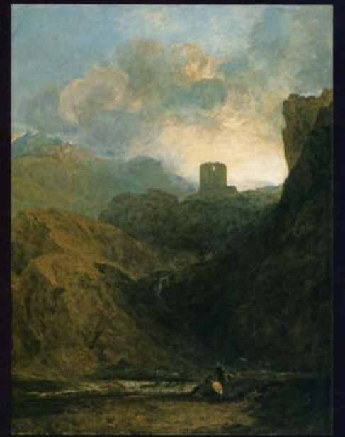
ジョゼフ・マロード・ウィリアム・ターナー 《ドルバターン城》 1800年 油彩・カンヴァス ロイヤル・アカデミー