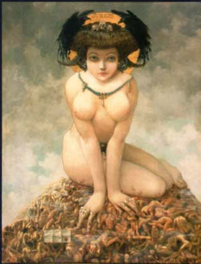
ギュスターヴ・アドルフ・モナサ 《彼女》 1905年 油彩・カンヴァス ニース美術館 ADAGP Paris & JASPAR, Tokyo, 2017 G0887, Collection Musée des Beaux-Arts Jules Chéret, Nice- Photo Muriel ANSSENS