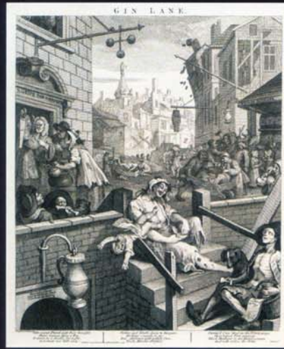
ウィリアム・ホガース [ビール街とジン横丁]より(ジン横丁) 1750-51年 エッチング、エンブレイヴィング・紙 郡山市立美術館

「ジンなんて、そんな強い酒ばかり飲んでたら体に毒だよ。せめてビールにしときなよ？えっ、ジンのほうがずっと安上がりだからいいって？しょうがないなあ。あんたたち病気だよ。うわっ、ちよっ、お母さん ども、ども」