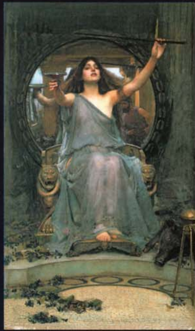
ジョン・ウィリアム・ウォーターハウス 《オデュッセウスに杯を差し出すキルケ》 1891年 油彩・カンヴァス オールダム美術館

「ようこそお越しくださいね。まずは一杯いかが？」王座から悠然とほほえむ女王キルケ。差し出された右手には、なみなみと酒の注がれた杯が。鏡に映る英雄オデュッセウス。これを飲まなきゃ男じゃないよ。さあ、どうする!?