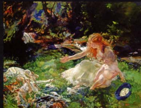
チャールズ・シムズ 《そして妖精たちは眼を持って逃げた》 1918-19年頃 油彩・カンヴァス リーズ美術館 Leeds Museums and Galleries (Leeds Art Gallery)