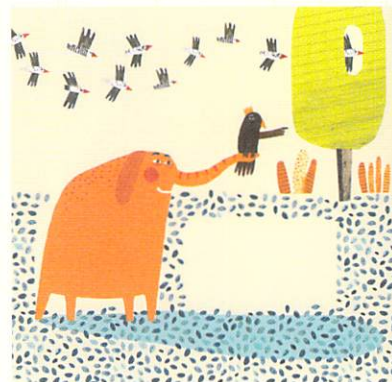
アウシュラキウドライト(リトアニア)「幸せはキツネにあり」