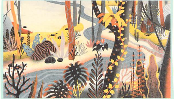
【特別展示】フアン・パロミノ(メキシコ)「はじまりの前に」