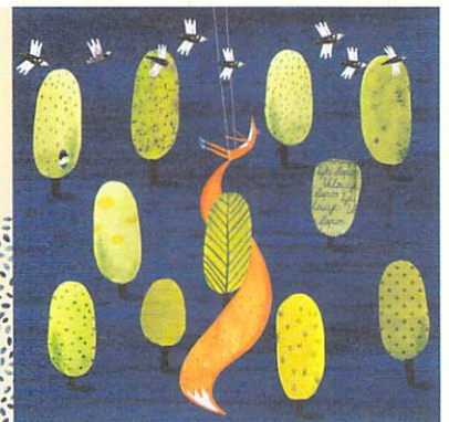
【特別展示】フアン・パロミノ(メキシコ)「はじまりの前に」