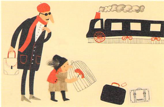
ラーミン・ヘイリーエ(イラン)「鳥と少年と列車」