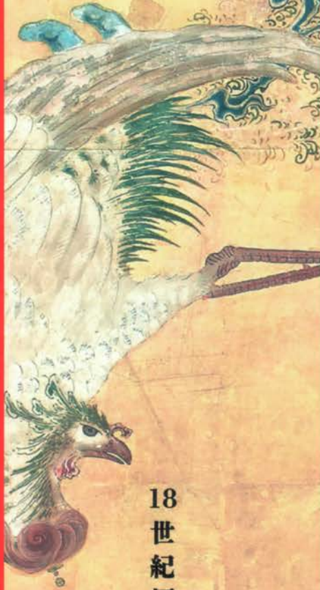
18世紀摂津の画人列伝