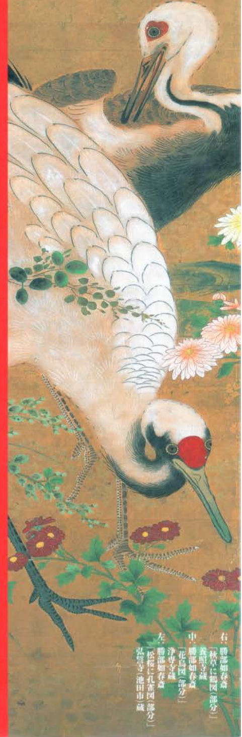
右 勝部如春画 「秋草に鶴図部分」 義昭子蔵 中 勝部如春画 「花鳥図部分」 浄専文蔵 左 勝部如春画 「松坂に孔雀図部分」 弘明寺池田市蔵

Otani Memorial Art Museum, Nishinomiya City