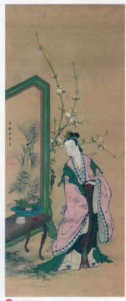
① 勝部如春齋「松桜に孔雀図(部分)」弘誓寺(池田市)蔵 ② 勝部如春齋「松楓に孔雀図(部分)」弘誓寺(池田市)蔵 ③ 勝部如春齋「十八天図(対幅のうち)」茂松寺蔵 ④ 勝部如春齋「西王母図」 ⑤ 勝部如春齋「小袖屏風虫干図巻(部分)」大阪市立美術館蔵