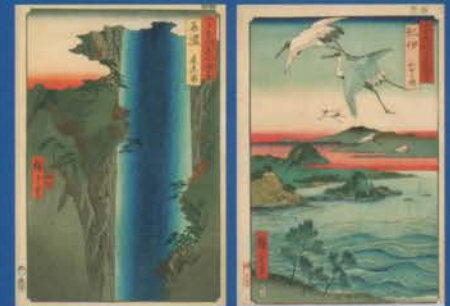
歌川広重 《六十余州名所図会 美濃 養老ノ瀨》 1853年 前・後期展示