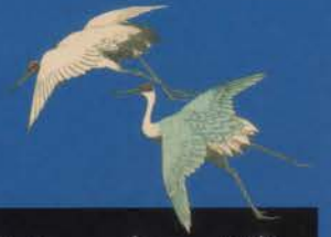
歌川広重 《名所江戸百景 深川万年橋》 1857年 前期展示