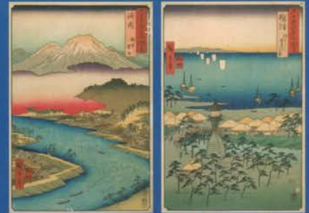
歌川広重 《六十余州名所図会 河内 牧方 男山》 1853年 前・後期展示