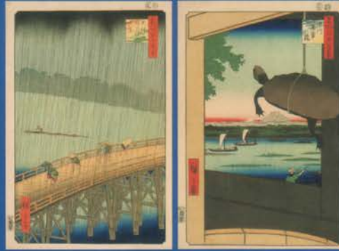
歌川広重 《名所江戸百景 大はしあたけの夕立》 1857年 後期展示