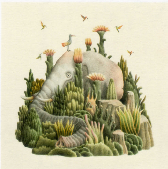
《隠れた動物の図鑑》ダニエレ・カステラーノ(イタリア)