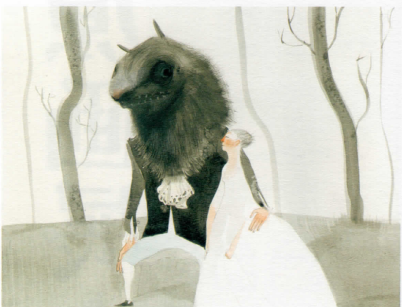
《美女と野獣》ヴェロニカ・ルッフアート(イタリア)