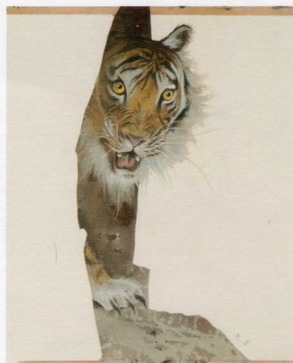
《ジャングル・ブック》アリョーシャ・ブラウ(ドイツ)