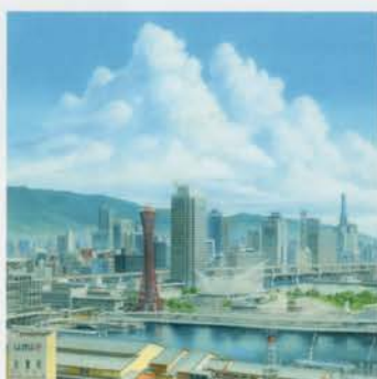
描き下ろし新作(文月の神戸) 2016年 ©山本二三