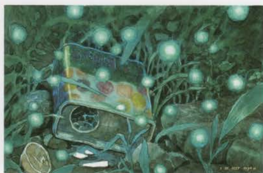
火垂るの墓(捨てられた思い出) 1988年 ©野坂昭如/新潮社,1988