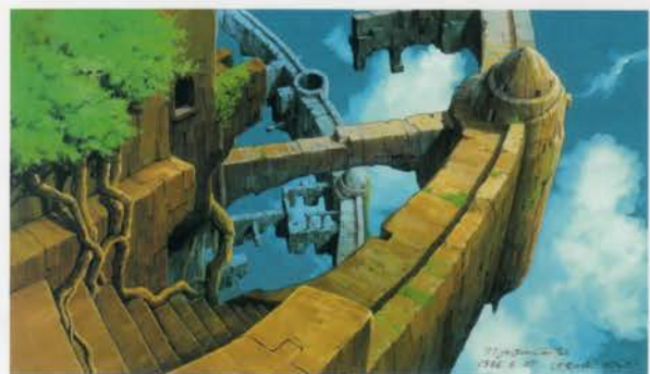
天空の城ラピュタ(荒廃したラピュタ) 1986年