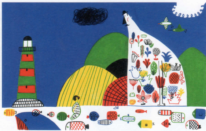
特別展示:《人魚と恋をした巨人たち》カタリーナ・ソブラル