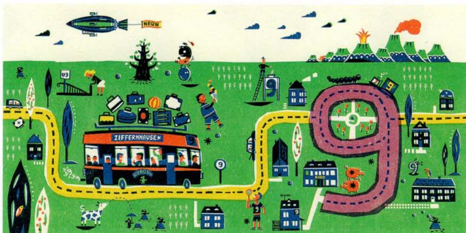
《日のあたる数字の野原からこんにちは》トム・アイゲンファーフェ(ドイツ)