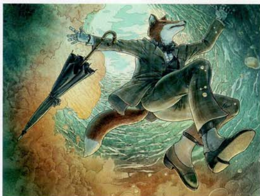
《キツネのテオの大ぼうけん》スコット・ブルム(カナダ)