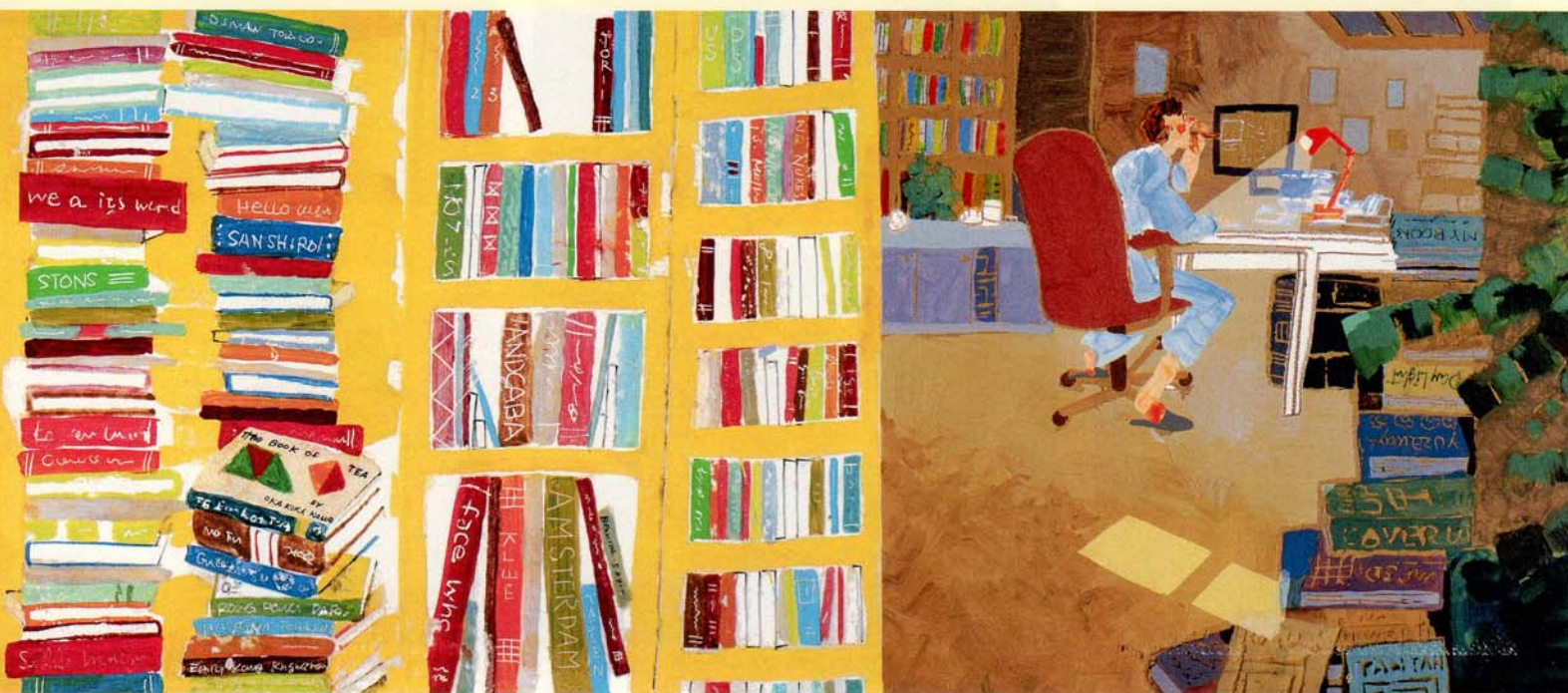
《シンディのあたらしいへや》藤島つとむ(日本)

〈特別展示1〉三浦太郎 ワークマン 〈特別展示2〉刀根里衣 ボローニャSM出版賞受賞記念