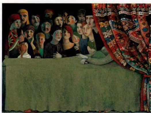
《マリクの本》アンナ・フォルラティ(イタリア)