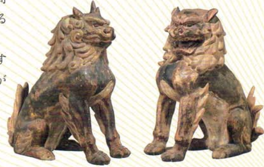
重要文化財《獅子・狛犬像》 鎌倉時代 和歌山・丹生都比売神社