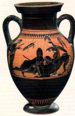
黒像式アンフォラ： ヘラクレスのネメアのライオン退治