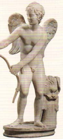
エロス(キューピッド)像