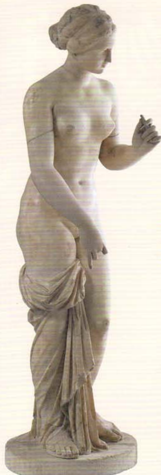
アフロディテ(ヴィーナス)像