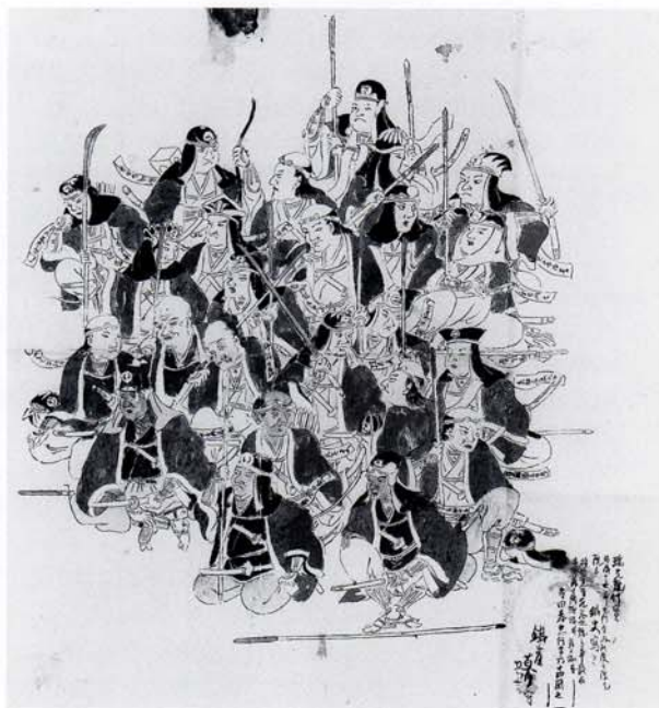
27 《粉本》四十七義士画像