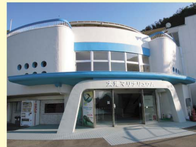
海洋水族館マリナリウム

大水槽は16.3m×12.0mのだ円形で、深さ5.0m、水量は620t。トンネル状観覧部と側面観覧窓を有し、「はるか」の腹びれや行動を間近に観察することができました。