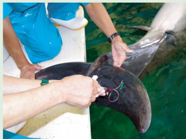
受診動作による採血。採取された血液は動物の様々な情報を知る手掛かりになります。