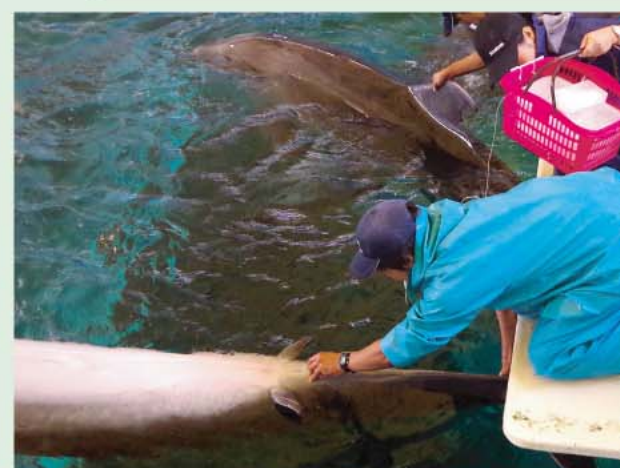
体温測定。毎日の体温測定は健康状態を知るために欠かせません。

※プロゲステロンは女性ホルモンの1種で、排卵後に形成される黄体から分泌されるホルモンです。プロゲステロン濃度を測ることで、排卵や妊娠を知ることができます。