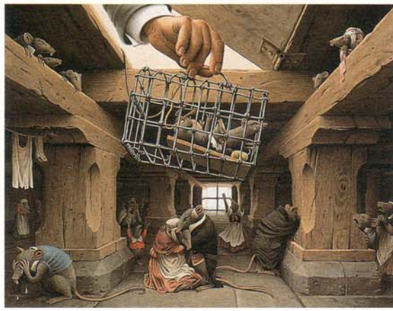
特別展示：《くるみわり人形》ロベルト・インノチェンティ(イタリア)

イタリア・ボローニャ国際絵本原画展は、イタリア北部の古都ボローニャ市で毎年開催されている、世界で唯一の子どもの本専門の国際見本市、ボローニャ・ブックフェアに併設された絵本原画のコンクール展入選作品で構成されています。1978年以来、当館で毎年開催している恒例の展覧会です。