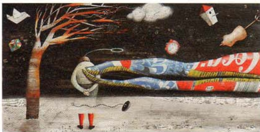
《アンジェロ(天使)》グレンダ・スプレリン(イタリア)