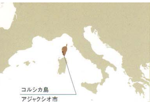
コルシカ島 アジャクシオ市

ナポレオンの生誕の地として有名なコルシカ島にあるフェッシュ美術館は、ナポレオン1世の母方の叔父であるジョゼフ・フェッシュ枢機卿(1763 - 1839) 個人のコレクションを基礎として設立されました。美術愛好家として著名であった彼の収集品は16,000点を数え、質・量ともに世界最大級を誇っていました。その後その多くが散逸しましたが、残されたイタリア絵画コレクションだけでも、フランス国内においてルーヴル美術館に次ぐ規模となります。