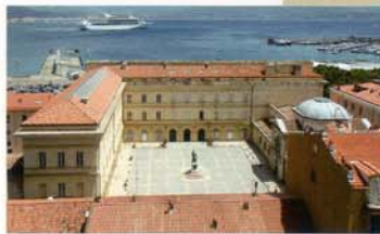
フェッシュ宮 (中央がフェッシュ美術館)