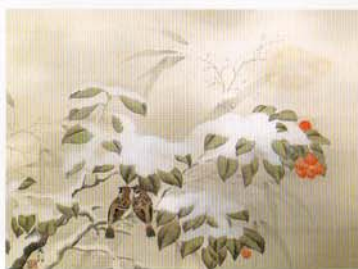
横山大観 冬之夕(大正14年)