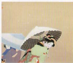
上村松園 牡丹雪(昭和19年)