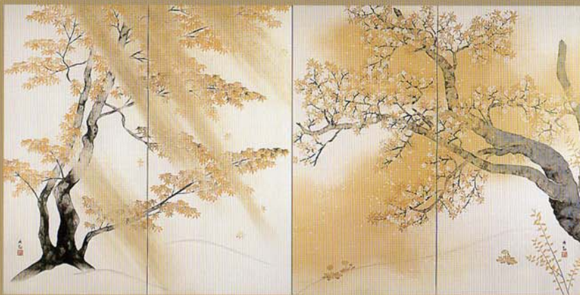
横山大観 春風秋雨(昭和9年)

2007年4月12日(木)～17日(火) 大丸心斎橋店 心おも美しい庭園―イングリッシュガーデンのすべてを―紹介