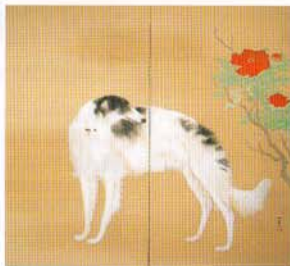
橋本関雪 唐犬図(右隻・昭和16年頃)