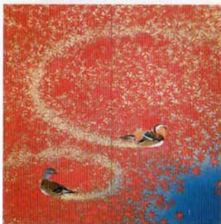
川端龍子 愛染(昭和9年)

「」のたび、大丸創業290周年と毎日新聞創刊135年を記念し、「足立美術館 横山大観と近代日本画の名品展」を開催いたします。足立美術館は、島根県安来市出身の実業家、足立全康氏が長年にわたって収集してきた美術品をもとに、昭和45年(1970)11月に開館しました。広大な日本庭園と優れた近代日本画を有する美術館として広く知られています。とりわけ横山大観(1868-1958)の初期から晩年に至るまでの代表作を収蔵し、質・量ともに日本一のコレクションとして高く評価されています。本展は、大観の「神州第一峰」、海・山十題のうち「曙色」「霊峰四趣・夏」「海潮四題・冬」などの傑作約20点をはじめ、竹内栖鳳、川合玉堂、菱田春草、上村松園、橋本関雪、小林古径、安田毅彦、伊東深水ら近代日本画の巨匠たちの名品を含めた50余点を紹介します。近代日本画壇に大きな足跡を残した巨匠たちの名品の数々を、この機会に心ゆくまでご堪能ください。