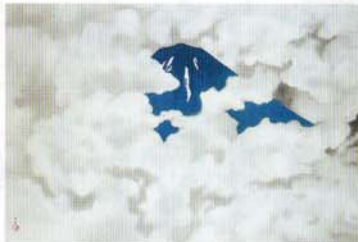
横山大観 霊峰四趣・夏(昭和15年)